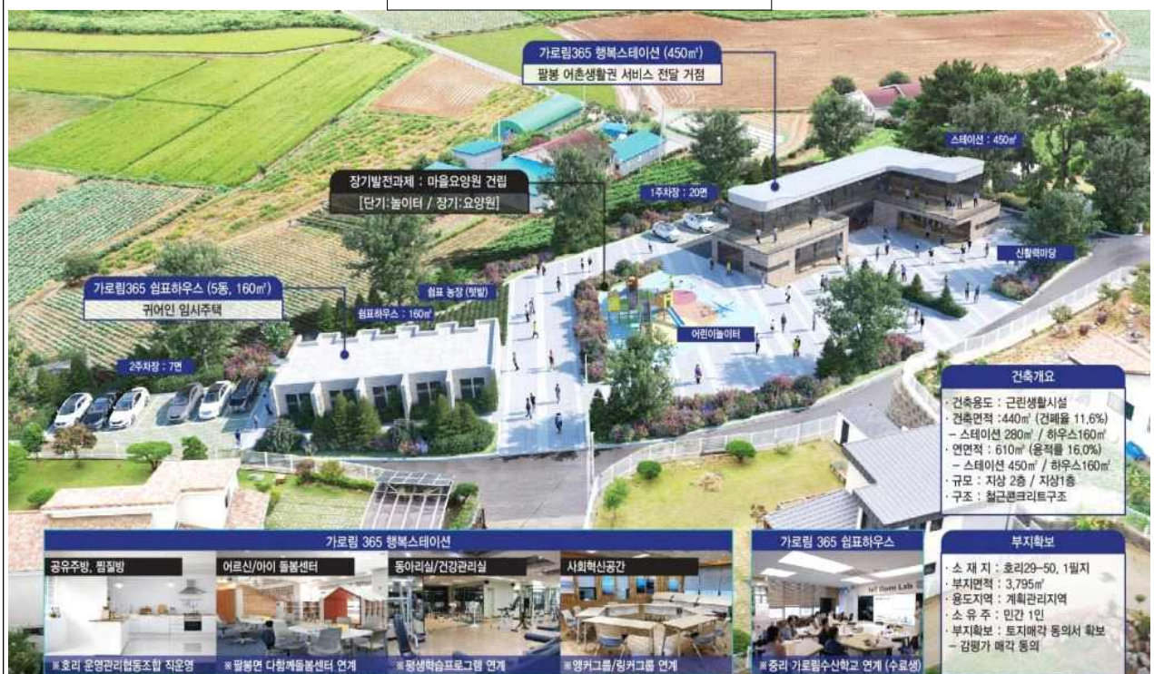
팔봉 생활권 사업 구상도